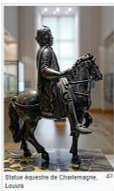
Statue équestre de Charlemagne, Louvre

https://fr.wikipedia.org/wiki/Sculpture_fran%C3%A7aise