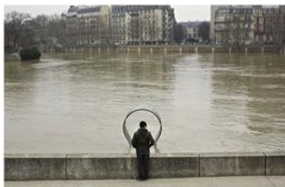
La Seine en crue, le 27 janvier 2018.