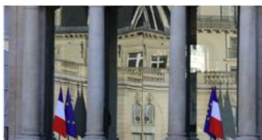
L'Élysée a fait de la francophonie une "cause nationale".

propositions des francophones de par le monde, en vue de la conception d'un "grand plan" pour le français que le président Emmanuel Macron présentera le 20 mars.